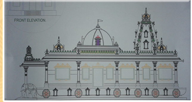
(ఈ దేవాలయం ఆగమ శాస్త్రాంతో చెప్పబడిన విధముగా తయారు చేయుటకు నిశ్చయించినారు)