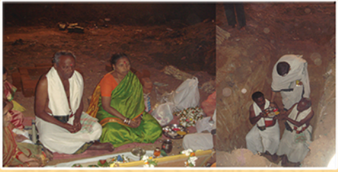
శ్రీ వాసవీ కన్యకాపరమేశ్వరి జయంతి ఉత్సవాలు